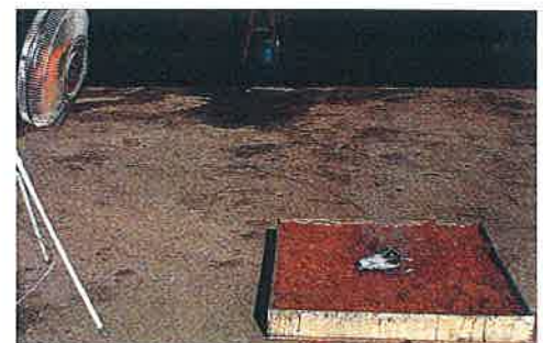
燃えている炭火、タバコを乗せた所