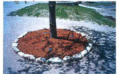
〔フジミ不燃マルチ施工例〕