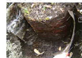
シートを剥がした根の状況

シートを剥がし樹木根茎の検証を行った。地下茎はシートに沿って成長しており問題なく抑制していた。