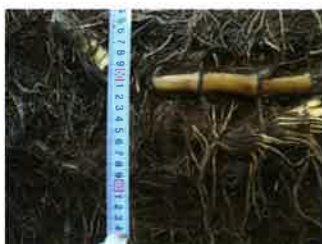
シートを剥がした根の状況

シートを剥がしモウソウ竹地下茎の検証を行った。地下茎はシートに沿って成長しておりこの現場の最大深さは80cmであった。貫通やくぐり抜けは無く完全に抑制していた。