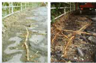
竹の地下茎の侵食