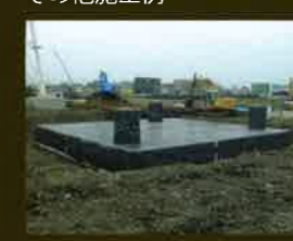
地下貯留層の防根