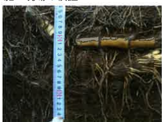
シートを剥がした根の状況

シートを剥がしモウソウ竹地下茎の検証を行った。地下茎はシートに沿って成長しておりこの現場の最大深さは80cmであった。貫通やくぐり抜けは無く完全に抑制していた。