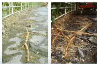
竹の地下茎の侵食