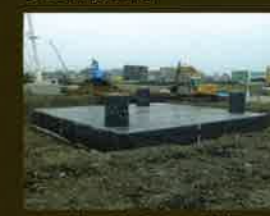
地下貯留層の防根