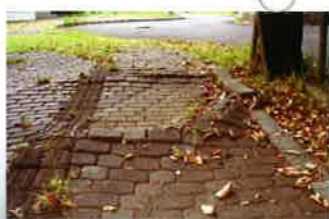
樹木の根による路盤の持ち上がり