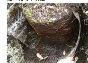
シートを剥がした根の状況

シートを剥がし樹木根茎の検証を行った。地下茎はシートに沿って成長しており問題なく抑制していた。