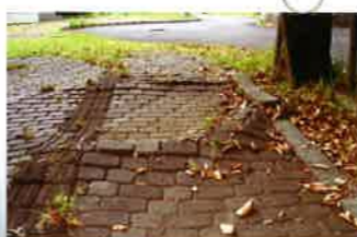
樹木の根による路盤の持ち上がり