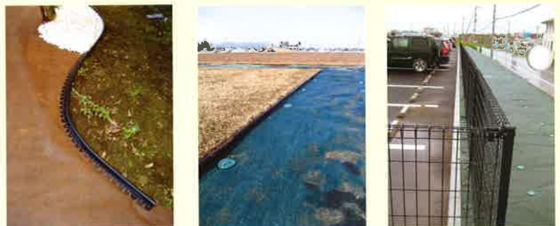
防草シート見切との組合せ