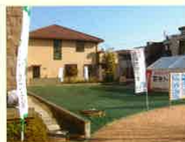
住宅展示場予定地