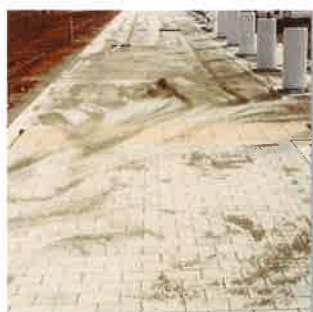
インターロッキング